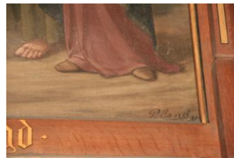
De gesigneerde 14 e statie in de Pancratiuskerk. (Poland '21)