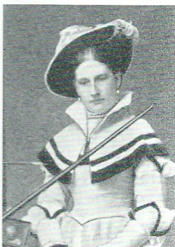
Vorstin Antonetta van Hohenzollern (1845-1913)