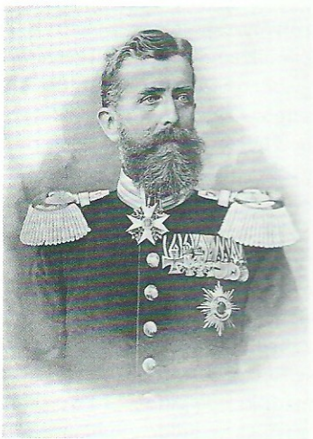
Vorst Leopold van Hohenzollern (1835-1905)

koningin Isabella op de Spaanse troon op te volgen. De verhoudingen tussen Frankrijk en Duitsland die toch al gespannen waren, zouden nog worden verscherpt, wanneer Leopold op het voorstel in zou gaan. Om die reden zag hij af van de Spaanse troon. Hiermee heeft hij echter niet kunnen voorkomen dat de Frans-Duitse oorlog van 1870 uitbrak. Vorst Leopold was dus een zeer grote figuur in Europa. Hij is gehuwd met Antonia, infante van Portugal, geboren op 17-2-1845 te Lissabon als dochter van koning Ferdinand II.